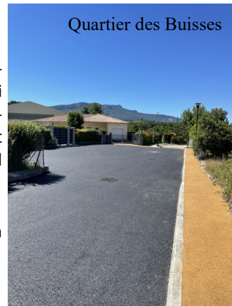
Quartier des Buissses

Dans le cadre de ces travaux, le goudron d'une partie du quartier des Buissses a été refait.