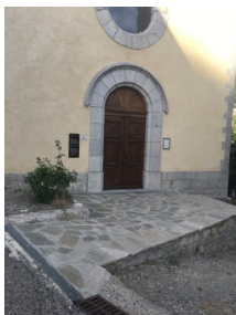
Parvis avant l'installation de la balustrade

Pour des raisons de sécurité un garde corps vient d'être fabriqué et installé sur le parvis de l'église de Saint Genis pour un cout de 3 380€.