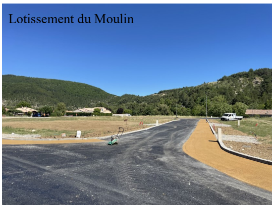
Lotissement du Moulin

Voilà! Les travaux du nouveau lotissement communal du Moulin ont pris fin. Celui-ci pourra prochainement accueillir à la construction, 15 maisons. C'était un sacré projet qui fut porté par la mandature précédente avec Edmond Francou et qui est réalisé depuis juin 2022.